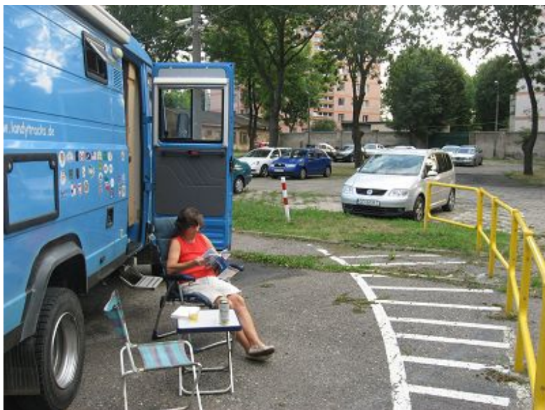
Unser Camp auf dem Parkplatz der Musikakademie

Als wir voller Eindrücke etwas müde den Rückweg antreten, fallen uns wieder die mehrfach auf der Strasse aufgestellten ATM's (Geldautomaten) auf. Als ich einen probiere, wird mir mitgeteilt, dass man hier einen eigenen Kurs anwendet, der mit 3,7 anstelle vom derzeitigen offiziellen 4,14 sehr mies ist. Aktion abbrechen drücken wir natürlich. Eine echter Bauernfang , auf die bestimmt viele Leute hereinfallen, die sich diesen Text entweder nicht durchlesen, oder vielleicht auch den richtigen Kurs nicht kennen.