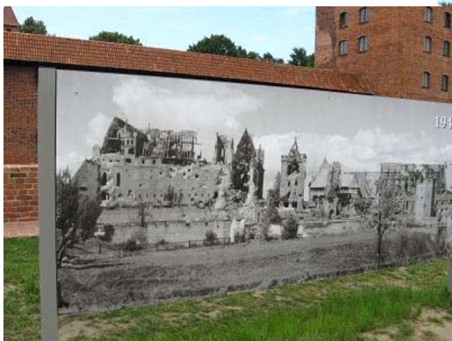
Oben: Beginn der Besichtigungstour. Links: Im Krieg wurde die Anlage fast total zerstört. Unten: Am Mittelschloss

Wir wollen das bevorstehende Mittelalterfest, dieses Jahr unter dem Motto Belagerung der Marienburg miterleben, das morgen beginnt. Hier treten auch unsere Bekannten aus Sachsen in mittelalterlichen Kostümen auf. Unmittelbar gegenüber dem Haupteingang erlaubt der grosse Parkplatz auch die Übernachtung, was für uns äusserst praktisch ist. Um 13 Uhr beginnt unsere 3- stündige Führung in Deutscher Sprache. Mit unserem Guide Adam haben wir Glück: Er spricht sehr gut deutsch und kennt sich hervorragend aus.