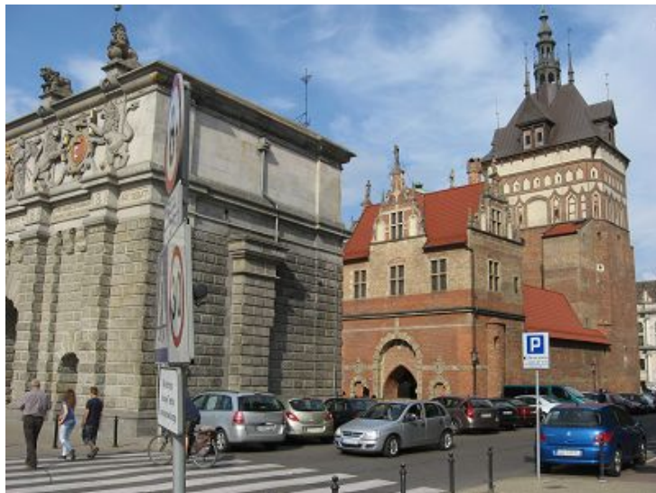
Stockturm und Peinkammer mit dem Bernsteinmuseum

Wir laufen weiter zu den verschiedenen Sehenswürdigkeiten, bis wir Stockturm und Peinkammer mit dem Bernsteinmuseum erreicht haben.