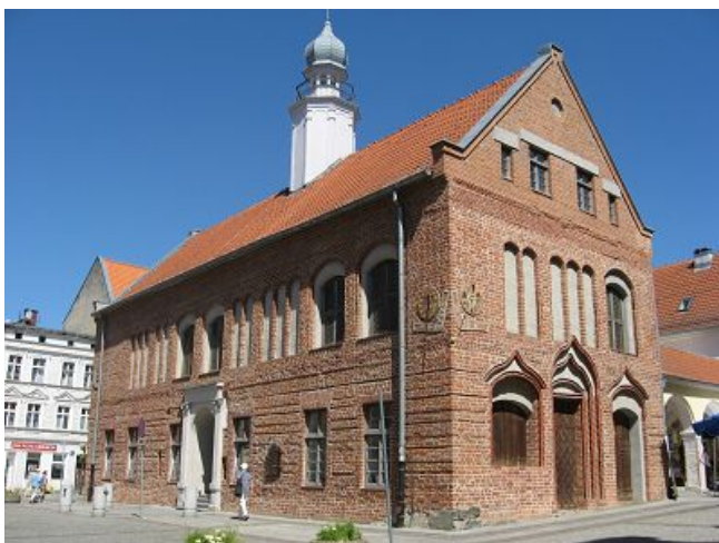
Rechts: Das Neue Rathaus

So sehen wir uns das hohe Tor und das Neue Rathaus (rechts) an, bummeln durch die kleine Altstadt, vorbei auch am alten Rathaus, das noch in Backstein erbaut wurde und an einer seiner Ecken eine hübsche Sonnenuhr hat (unten).