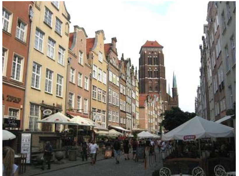
Marienstrasse mit Marienkirche