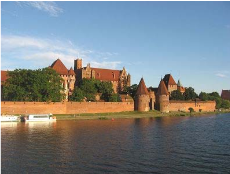
Abschied von der Marienburg

19.07.2014, Samstag und 20.07.2014, Sonntag